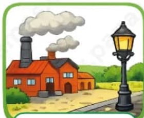
Hace unos 200 años