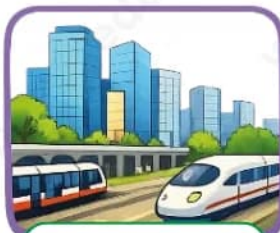
En la actualidad