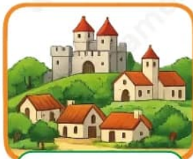
Hace unos 1.000 años