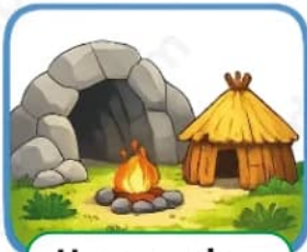
Hace muchos miles de años

Completa con ideas cortas. Usa palabras del tema (aldea, castillo, fábricas, ciudad, servicios...).